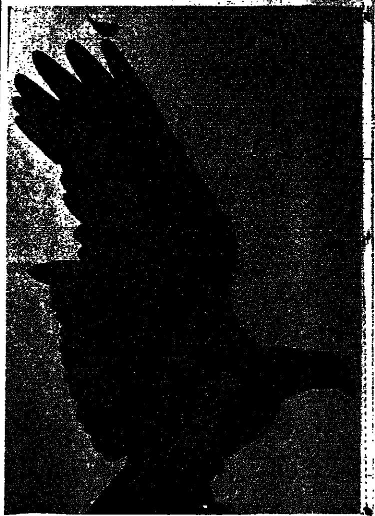
يقوم على ضفاف نهر التيمس بلندن تمثال من الصلص يمثل نسرا ضخما وذلك تخليداً لتكري كل الذين عملوا في قوات الكومونولث الجوية ايام الحرب العالمية الثانية. وقد رأى هذا النورس المستوحى (الصورة) في اعتلاء النسر المعدني فرصة سلتحة يمثل من خلفها على وسط لندن ولكن مع مراعاة هبة صاحب التمثال ووقاره. وذلك بالوقوف على طرف الجناح وعدم الاقتراب من الرأس.